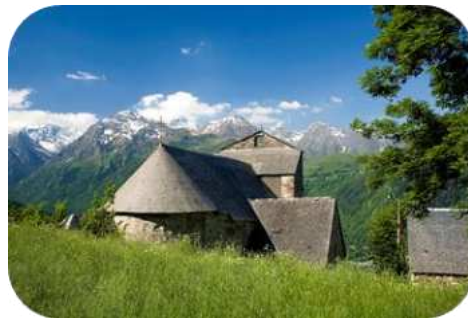
Eglise Saint Calixte

Se garer sur le parking à l'entrée du village de Mont et passer à gauche de l'église (table d'orientation) pour suivre l'itinéraire balisé N°4. A Saint-Calixte, passer à droite de l'église pour suivre l'itinéraire balisé N°5 en direction de Cazaux-Dessus. Après 100 m sur une petite route, suivre le chemin qui monte à droite et mène à Cazaux - Dessus.