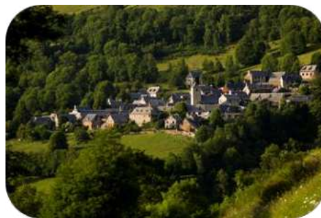
Village de Mont

Redescendre à gauche pour traverser le village et après la chapelle, suivre le sentier qui monte tout droit jusqu'à la route forestière de Balencous. La suivre vers la gauche pendant 2 kms en laissant à gauche deux pistes qui descendent. Au niveau d'une ruine (murs) prendre la première piste à droite qui monte en haut de la forêt de sapins (point de vue). Monter alors à gauche par une piste en lisière de forêt. A une plateforme, monter tout droit dans les estives (raide) par des traces de sentier jusqu'à un replat (altitude 1722 m) et suivre à droite une piste pastorale qui descend à flanc de montagne. Passer une première clôture, puis une deuxième sur un petit col (abreuvoir) et descendre par un sentier. Après quelques lacets, descendre par ce sentier vers une forêt de chênes, puis par un chemin plus large jusqu'à Mont. En bas d'une rue pavée, rejoindre à gauche l'église puis le parking.