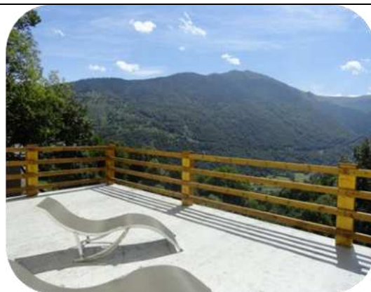
Terrasse avec vue !