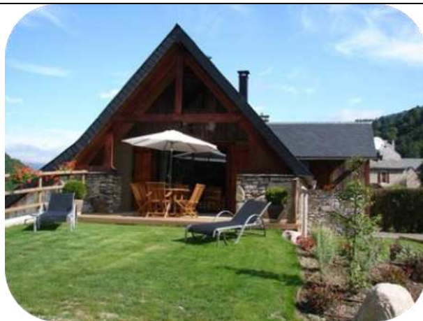
Gite de charme à Bordères Louron