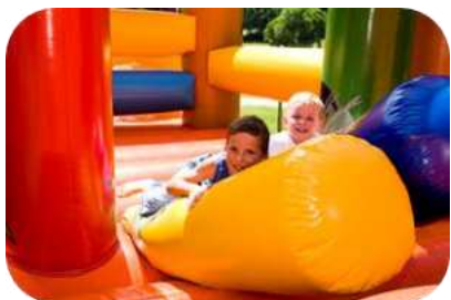
« Ludic Park » pour les enfants