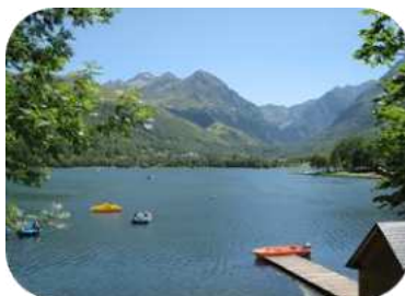
Lac de Génos Loudenvielle