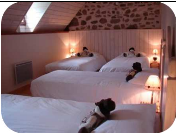
Un amour de chambre d'enfants !

Pour en savoir plus, une adresse internet spécifique a été créée : www.unamourdegite.com