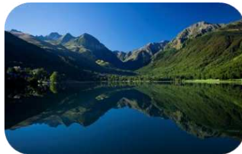
Lac de Génos Loudenvielle

De l'église de Loudenvielle, emprunter la deuxième rue à droite après la Poste (chemin de Cidelongue) et suivre l'itinéraire balisé N°2. Après la Tour de Moulor, descendre à gauche vers le lac de Génos-Loudenvielle. Traverser la route (attention aux voitures) puis la passerelle bleue et longer la rive du lac en direction de Loudenvielle. Après le court de tennis, emprunter la passerelle sur la Neste et rejoindre l'église de Loudenvielle par la rue de Cazalis puis celle du pic des Gourgs Blancs.