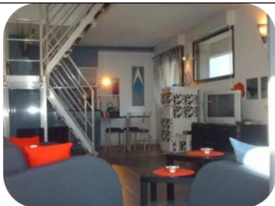
Gite contemporain à Avajan