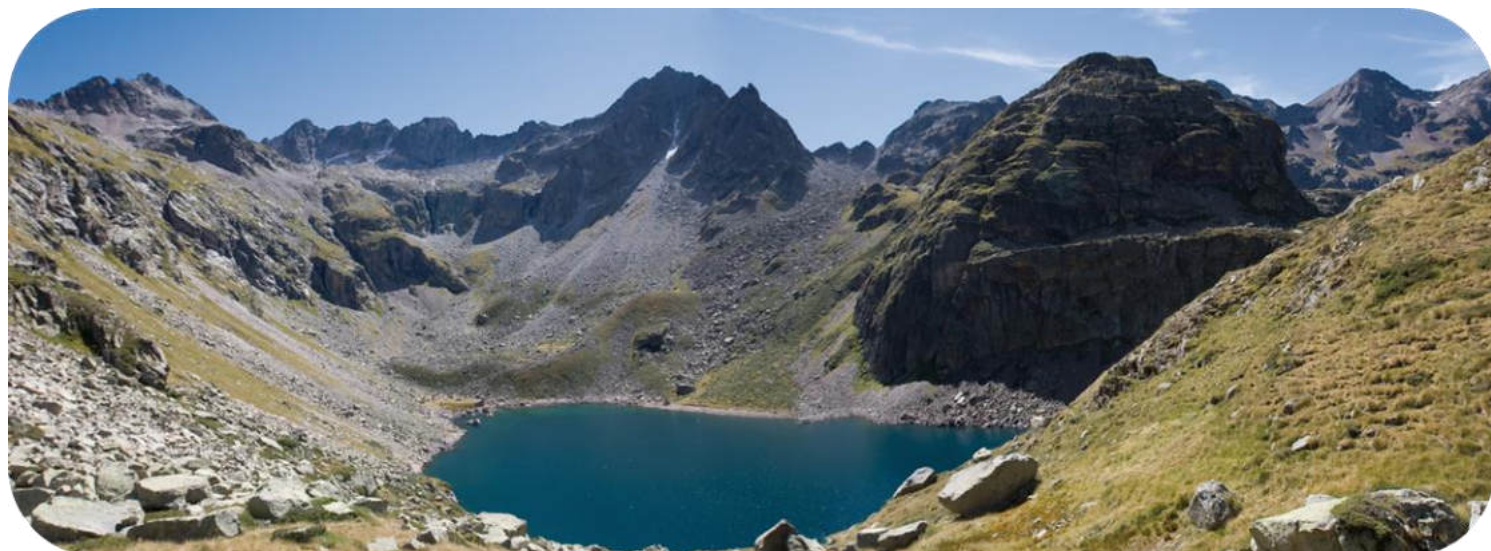
Lac de Pouchergues, dans le site classé de la haute Vallée du Louron