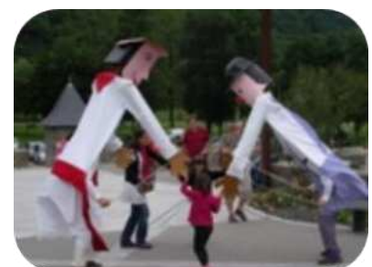
Spectacles : gratuits avec le Pass Louron