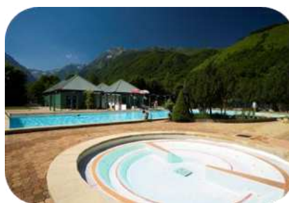
Ludéo : gratuit avec le Pass Louron