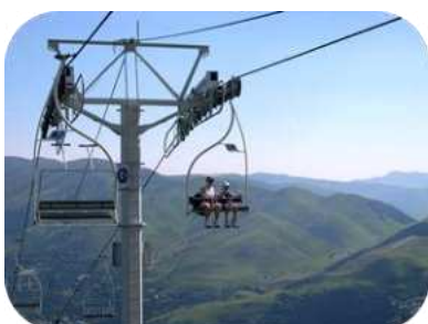
Télésièges : gratuit avec le Pass Louron