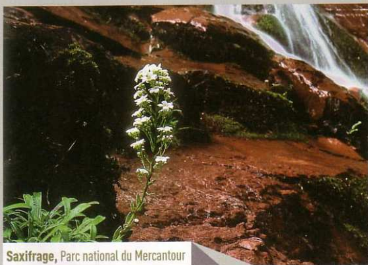
Saxifrage, Parc national du Mercantour

Inféodé aux altitudes élevées, le lagopède est menacé de disparition.