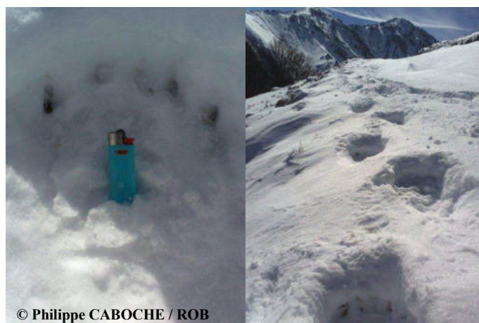
Piste d'un ours mâle découverte lors d'une randonnée en ski sur la commune de Bonac Irazein (09).

Les documents photographiques obtenus ont permis de détecter 5 mâles adultes minimum. Une vidéo de Pyros datant du 31 octobre 2013 (récoltée en février 2014) le montre, en comportement de marquage, urinant au pied d'un arbre équipé d'un appât térébenthine.