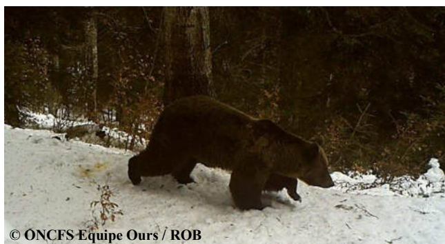
Extrait d'une vidéo automatique réalisée, le 29 mars 2014, sur la commune de St Lary (09).