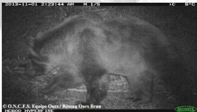
Photo automatique d'un ours adulte mâle, le 1er novembre 2013, commune de Melles (31).