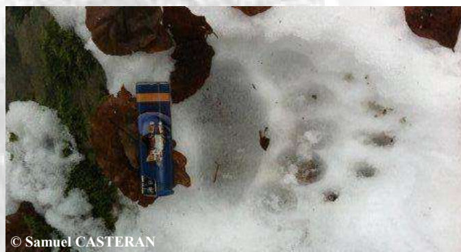
Photo d'empreinte d'une patte avant gauche