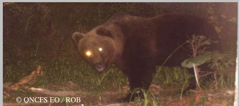
Ours indéterminé du 29 juin 2013. Photo automatique relevée, le 16 juillet 2013, sur la commune d'Estaing (65).

44 séries de photos-vidéos automatiques ont été relevées. Vous trouverez, une sélection de ces documents en cliquant sur le lien suivant : http://www.oncfs.gouv.fr/Photos-et-videos-dOurs-Brun-dans-les-Pyrenees-amp-nbsp-ru533/Images-dours-Brun-Juillet-2013-ar1559 Plusieurs vidéos de Balou et Pyros renseignent sur les déplacements importants qu'ils ont réalisés en Juillet.