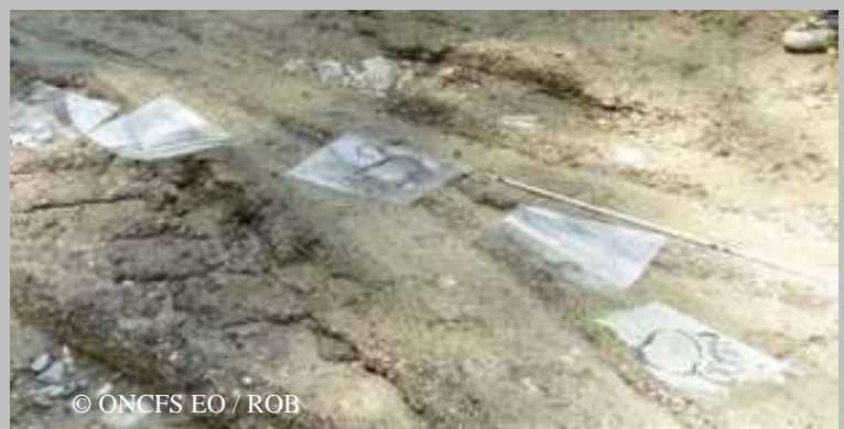
Sur une piste d'ours, faire un maximum de relevés (dessins d'empreintes et mesures au pied à coulisse).

Ce mois de juillet n'a pas encore permis de détecter la présence de femelle suitée, ce qui n'est pas anormal au vu des observations de ces dernières années. En revanche, dans les Pyrénées centrales, les mâles adultes se sont montrés particulièrement actifs, notamment Balou qui fut photographié sur Melles et 5 jours après sur Couflens (33 km à vol d'oiseau).