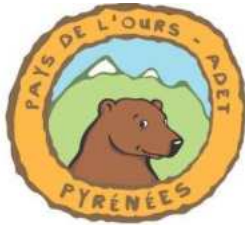
Pays de l'Ours - Adet