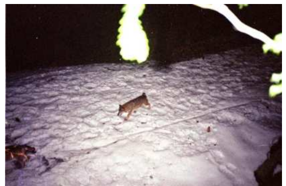
F. Bouchet-Virette et L. Perrin / ONCFS- Belledonne, 2003 Deux loups dans le massif de Belledonne, pris sur le vif sur un passage identifié par le suivi des traces