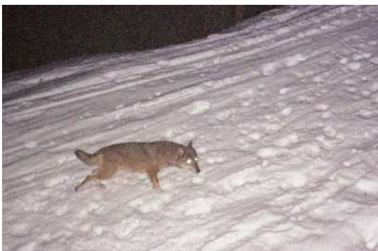
La pose du piège photo, un outil à développer pour le suivi de l'espèce

F. Bouchet-Virette et L. Perrin, Correspondants réseau "Grands Carnivores" / ONCFS SD 38