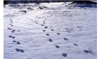
Abriès, 2002 Pistes de 4 loups relevées dans la neige fraîche dans le massif du Queyras

Les identifications des animaux ayant fréquenté le Mercantour seront disponibles d'ici l'été prochain, et constitueront autant de nouveaux éléments pour mieux comprendre la dynamique de colonisation du loup dans les Alpes.