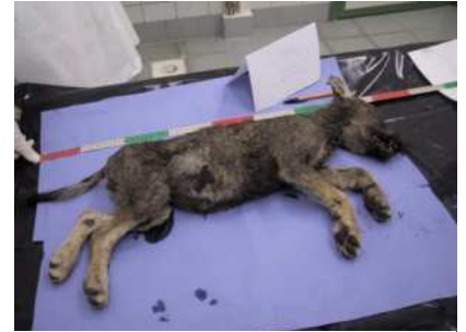
T. Dahier / ONCFS et D. Gauthier / LDV 05 - Autopsie du louveteau trouvé mort par D. Archimbault (PN Mercantour) en Vésubie en Août 2002

(non encore réalisées) permettront de connaître l'origine de l'appât utilisé.