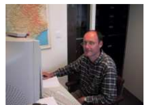
Les nouvelles têtes de l'animation du réseau loup lynx dans les Alpes