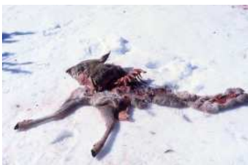
R. Roy / ONCFS - Abrès, 2002 Carcasse de chevreuil tuée par des loups trouvée au détour d'une piste suivi dans le massif du Queyras

Par avance, merci d'alimenter l'actualité nationale du loup par vos expériences locales qui peuvent servir à des collègues éventuellement confrontés à la même problématique.