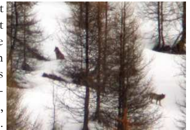
S. Michel / CRAVE - Ristolas, 2003

d'Abriès (05) en témoigne de même que 4 autres observations visuelles effectuées ces 3 dernières années par les pisteurs ou les touristes depuis la terrasse d'un café.