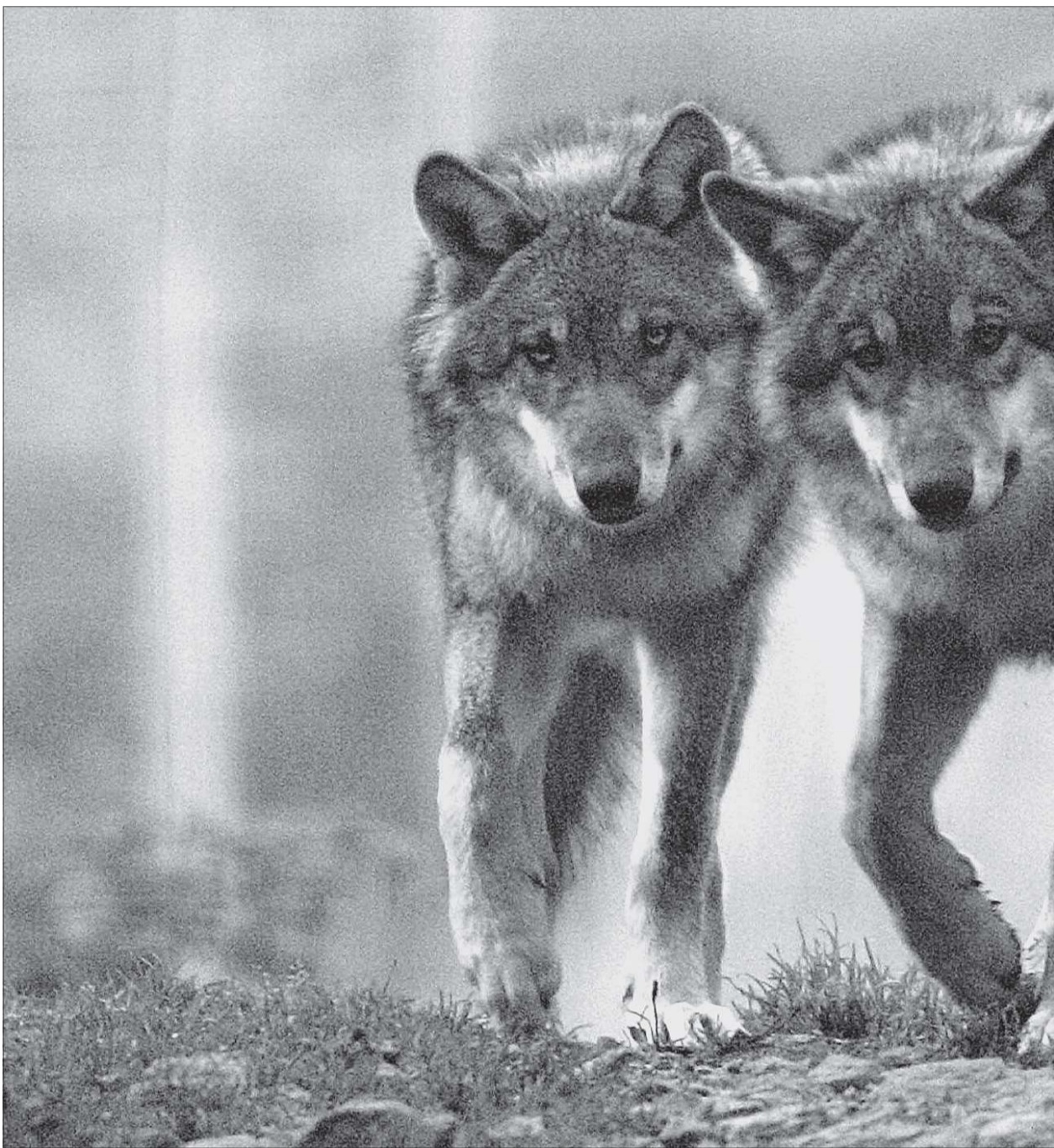
La population de loups croît de 8 à 30 % par an en France.

Le loup reste pour l'instant cantonné à l'est de la chaîne, dans les