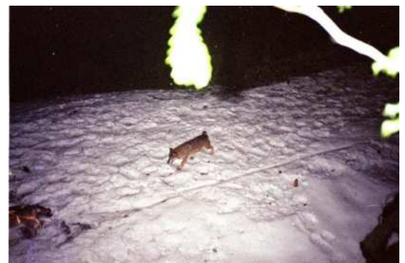
F. Bouchet-Virette et L. Perrin / ONCFS- Belledonne, 2003 Deux loups dans le massif de Belledonne, pris sur le vif sur un passage identifié par le suivi des traces