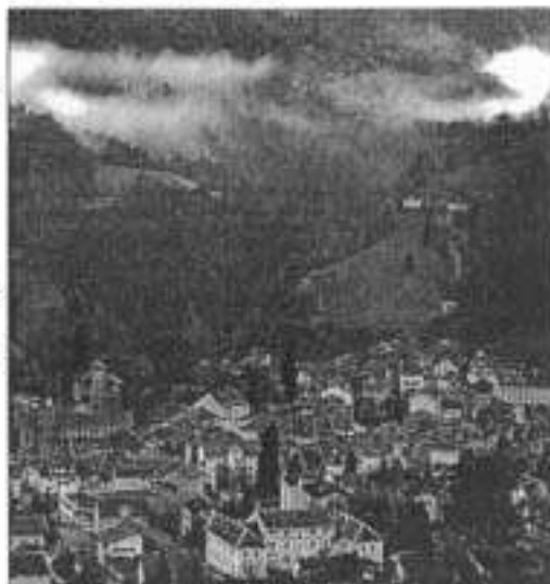
C'est sur la place du David que le cadavre du loup a été retrouvé.

La dépouille de l'animal, attachée par les pattes arrière aux branches d'un arbre a été découverte, dimanche, tout près du casino avec une pancarte sur laquelle était inscrit "Ras le bol du loup".