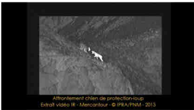
Figure et image ci dessus : un des axes de travail du projet CanOvis, Les relations CPT-loup : réflexion sur l'effet dissuasif à long terme du CPT pour déterminer les facteurs et leviers d'action pour affirmer la supériorité du chien face au prédateur

chiens à celle des troupeaux en configuration « ordinaire », mais aussi face aux diverses « perturbations » liées à leur environnement, à fortiori en présence de loups.