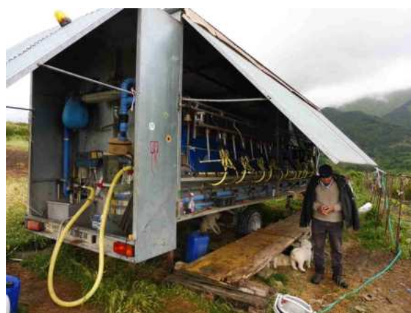
Installation de traite mobile

L'un des éleveurs rencontrés est emblématique des transformations en cours : âgé, il conduit encore en été 350 brebis sardes en montagne où il fabrique le pecorino avec des installations légères (traite mobile sur remorque, fromagerie dans un caisson de camion frigo)... mais son fils installe un atelier hors-sol de 250 Lacaune dans la plaine du Latium, pour livrer le lait à un industriel.