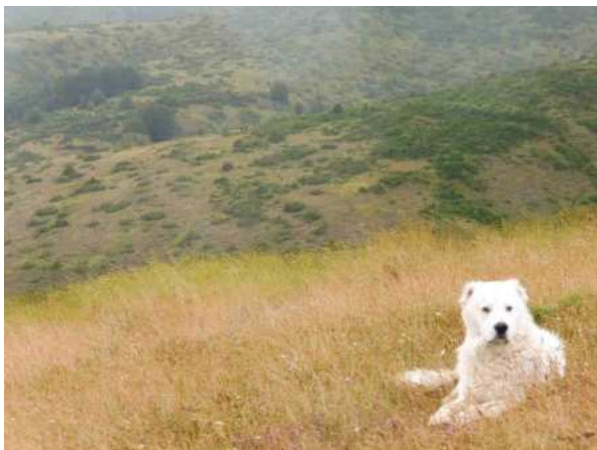
Faible pression de pâturage et fermeture des milieux à 1500 m dans les Abruzzes

Ces bouleversements se lisent aussi dans les paysages de Molise et des Abruzzes, qui se sont très fortement boisés en 40 ans en moyenne montagne (500 à 1000 m) par des accrus de feuillus (on est en montagne méditerranéenne bien arrosée, aux dynamiques de végétation rapides) : mes interlocuteurs me montrent des paysages entièrement fermés et me disent qu'ils les ont connus ouverts, cultivés et pâturés dans leur enfance, c'est-à-dire il y a une quarantaine ou une cinquantaine d'années. En plus haute montagne vers 1500 m, les dynamiques de fermeture des milieux ouverts, plus lentes, sont enclenchées avec des faibles pressions de pâturage parfaitement identifiables.