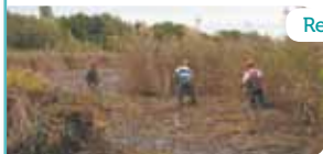
Restauration d'une roselière.

Les roselières sont l'habitat privilégié du butor étoilé ( Botaurus stellaris ). Un inventaire des roselières constituait donc la première