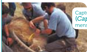
Capture d'un bouquetin des Alpes ( Capra ibex ) mâle et prise de ses mensurations, en vue d'une réintroduction.

La stratégie de réintroduction des bouquetins en France (2000-2015), pilotée par la DREAL Rhône-Alpes, est