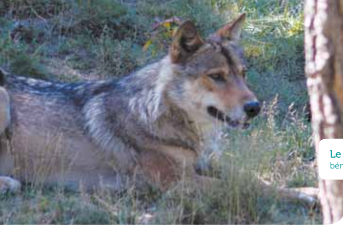
Le loup ( Canis lupus ) bénéficie d'un plan 2008-2012.