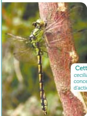
Cette libellule ( Ophiogomphus cecilia ) fait partie des espèces concernées par le plan national d'actions en faveur des odonates.

Dans le cadre du plan national d'actions en faveur des odonates, 14 agents de l'Office national de l'eau et des milieux aquatiques (Onema) et 6 agents de l'Office national