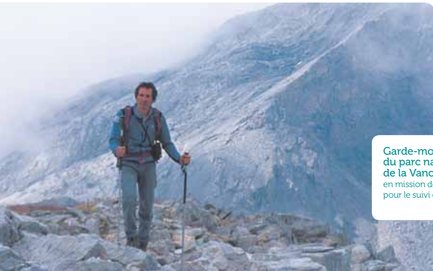
Garde-moniteur du parc national de la Vanoise en mission de surveillance pour le suivi du milieu naturel.