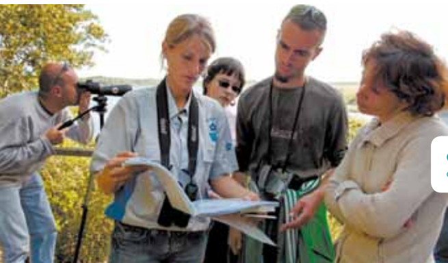
Guide et participants d'une sortie organisée dans un parc naturel.

Les agents des parcs naturels régionaux, des réserves, des conservatoires d'espaces naturels... interviennent régulièrement dans la mise en œuvre des plans nationaux d'action du fait de la présence d'une ou plusieurs espèces sur leur territoire.