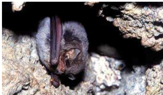
■ Le Minoptère de Schreibers ( Myotis schreibersii ), classé "Vulnérable"