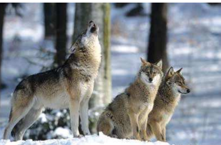
■ Le Loup gris ( Canis lupus ), une espèce classée "Vulnérable"

Malgré la situation encore préoccupante de plusieurs espèces, le résultat des évaluations montre que les actions de conservation entreprises pour les mammifères sur le territoire métropolitain portent leurs fruits (protection réglementaire nationale et européenne, plans nationaux d'action, conservation des habitats naturels...). Ces résultats encourageants incitent à poursuivre les efforts et à renforcer l'action pour continuer à améliorer, dans les années à venir, la situation de ces espèces.