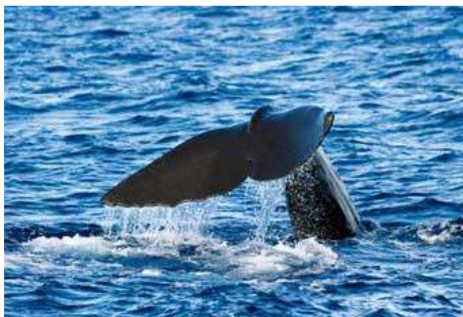
■ Le Cachalot ( Physeter macrocephalus ), une espèce "Vulnérable"

Concernant les cétacés, près de la moitié des espèces a dû être placée dans la catégorie "Données insuffisantes", en raison du manque de connaissances et de données disponibles. Pourtant, certains de ces mammifères marins pourraient bien être menacés en France, car ils sont affectés par de multiples