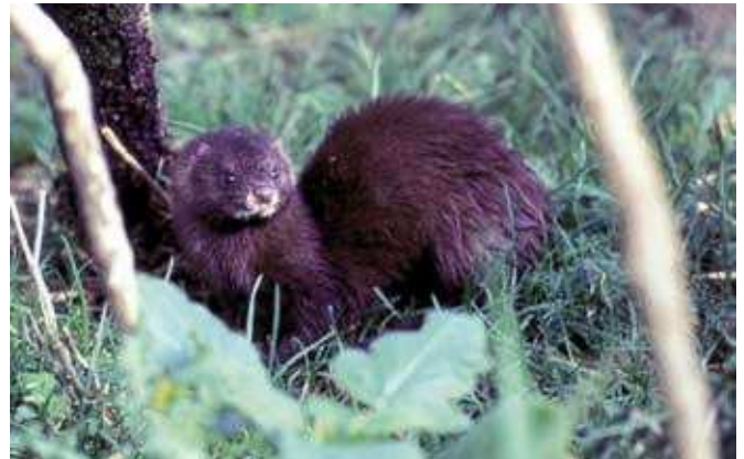
■ Le Vison d'Europe ( Mustela lutreola ), une espèce classée "En danger"

De plus, des évaluations complémentaires ont été réalisées pour certaines sous-espèces continentales et pour certaines populations d'espèces marines (cf. tableau p.11).