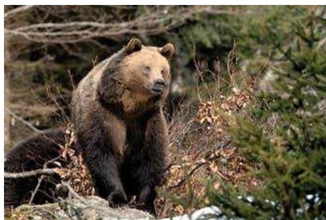
■ L'Ours brun ( Ursus arctos ), classé "En danger critique d'extinction"

NE : Non évaluée (espèce non encore confrontée aux critères de la Liste rouge)