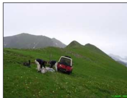
Préparation des charges - le 4X4 n'ira pas plus loin !

Comme déjà constaté l'an passé, c'est typiquement le genre d'opérations fastidieuses où il est intéressant d'être nombreux ! Et malgré tout, les sessions restent « sportives » de par les dénivelés à parcourir, la raideur des versants et les charges à déplacer. Nos différentes interventions représentent 10 jours de présence sur site et 35 journées-bénévole de labeur.