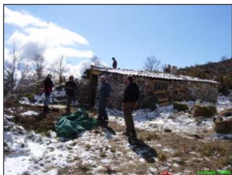
Malgré la neige les travaux tirent à leur fin Montagne de Lure - 05

Du 19 au 23 mars, c'est poursuivi et terminé le chantier entrepris à l'automne 2007, aux limites S-O du département des Hautes Alpes, sur un secteur pastoral nouvellement fréquenté par un ou plusieurs loups.