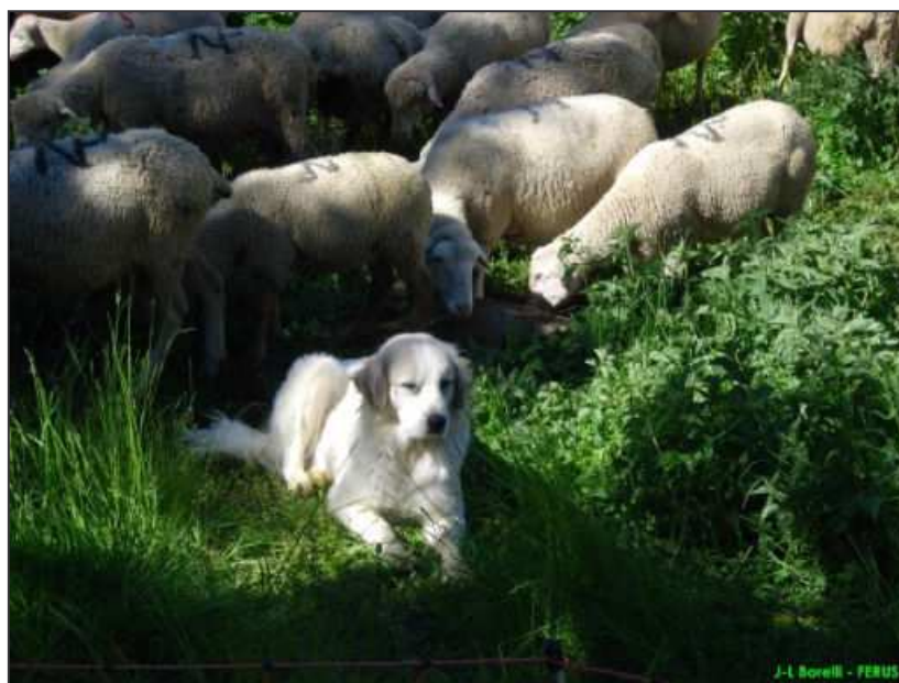
Le patou, compagnon de « travail » fort apprécié par les bénévoles !