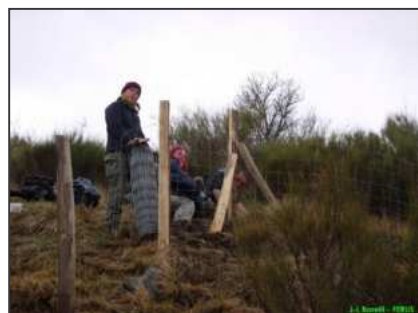
La pose délicate du grillage Monaes - 04

Un nouveau projet de parc fixe de pâturage, dans ce massif des Alpes de Haute Provence.