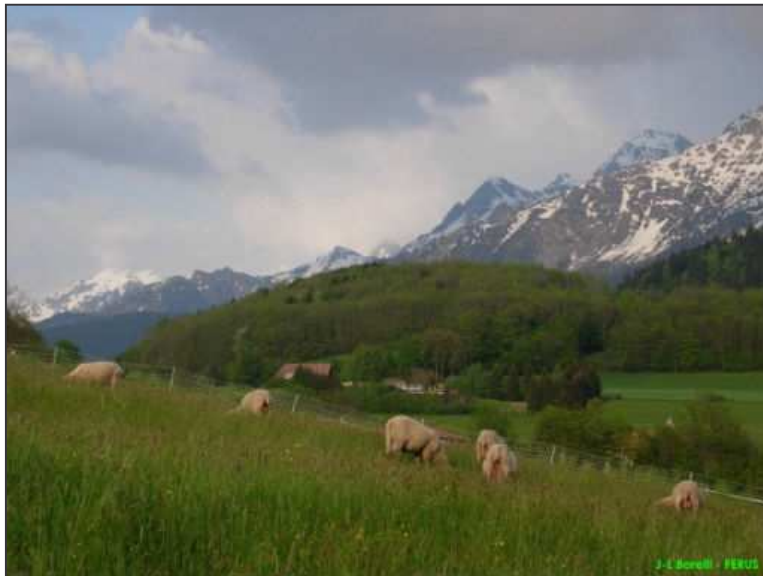
Les brebis au près, bien avant la montée en alpage – Belledonne - 38

Cette forme de solidarité active offre une occasion de rencontre et d'échanges à des citoyens dont les logiques de vie sont parfois très éloignées. Mieux se connaître, mieux comprendre et se comprendre sont des objectifs incontournables de ce projet.