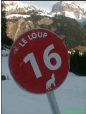
« piste rouge » pour le loup en Hte Savoie

Après les données 2007 en demi-teinte, les suivis hivernaux et hurlements provoqués estivaux de cette année, ont rendu de meilleurs résultats quant au statut de la population de loups française. Cette espèce poursuit – lentement - son expansion démographique et géographique dans notre pays (cf. sources Réseau Loup ONCFS) Par ailleurs, au moins cinq cadavres ont été retrouvés officiellement, avec pour cause de mortalité, le braconnage bien sûr et surtout pour 3 d'entre eux, une collision avec un véhicule.