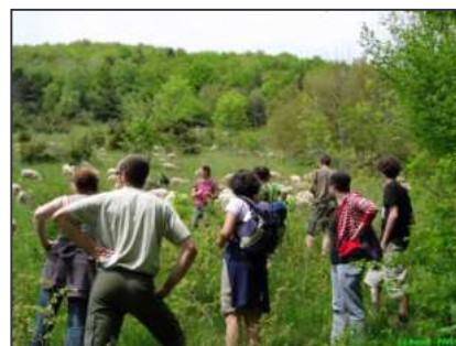
Visite du troupeau au pâturage stage de Belledonne - 38