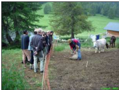
Description de la tonte sur une brebis Stage en Mercantour

Un groupe réduit pour ce séjour – 7 personnes contre 10 en 2007 - et contre toute attente, très « étudiant » alors que cette formule a été mise au point (entre autre) pour toucher un public à priori d'actifs jouant, à cette époque, avec les « ponts » et les RTT pour se libérer un peu de disponibilité sans trop « manger » de jours de congés.