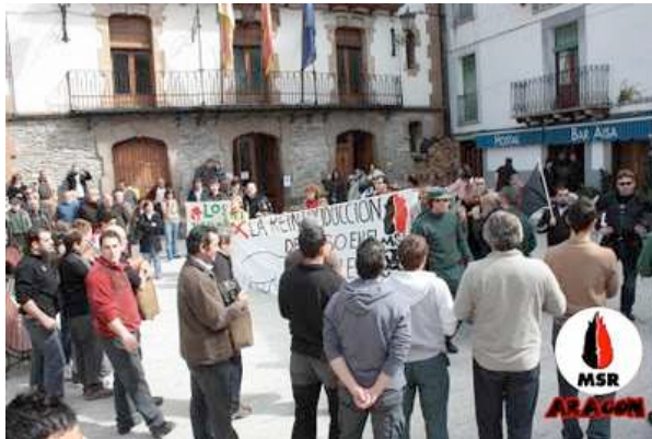
Momentos cortos de tranquilidad