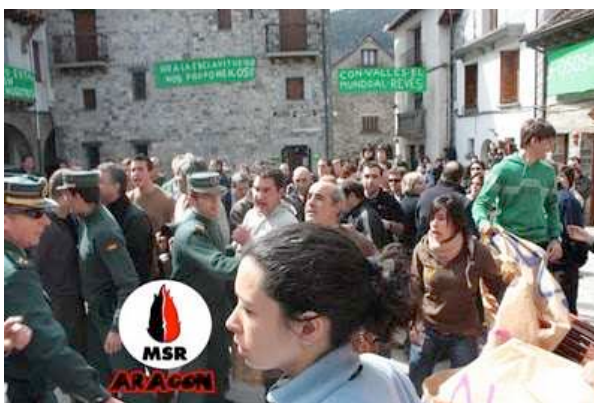
Momentos de tensión después de su enésimo intento de reventarnos la concentración 2