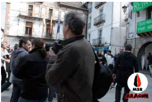
La llama se defiende y recupera su bandera de Aragón