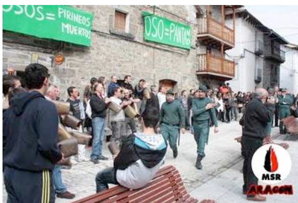
Llegan más guardias civiles