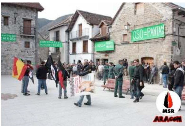
Momentos antes del inicio del acto