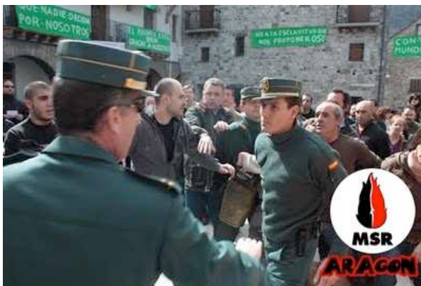
Momentos de tensión después de su enésimo intento de reventarnos la concentración