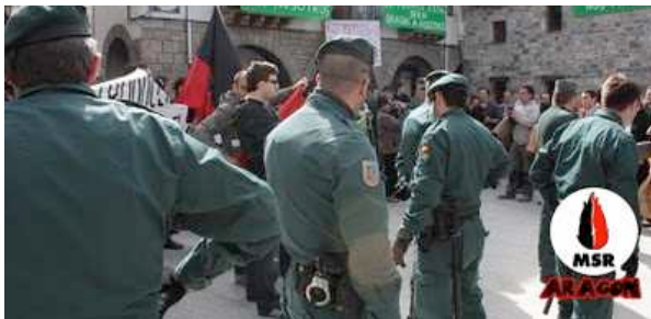
Llegan más efectivos de la guardia civil