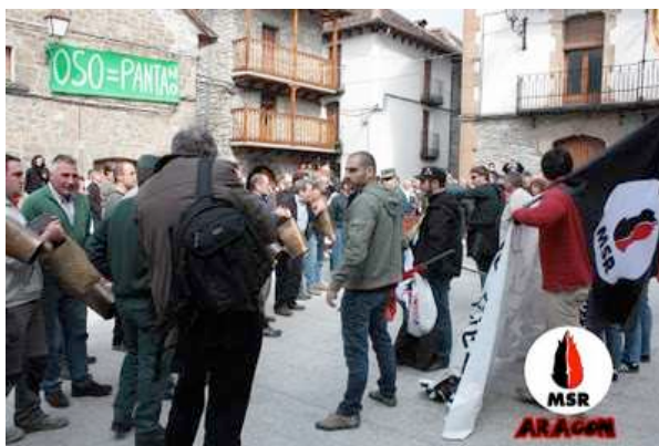
Comienza el acoso y no bajamos la guardia