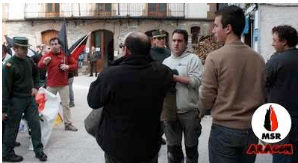
Momento exacto en el que nos quitan la pancarta