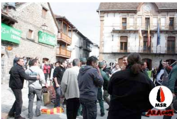
Nos roban una bandera de Aragón