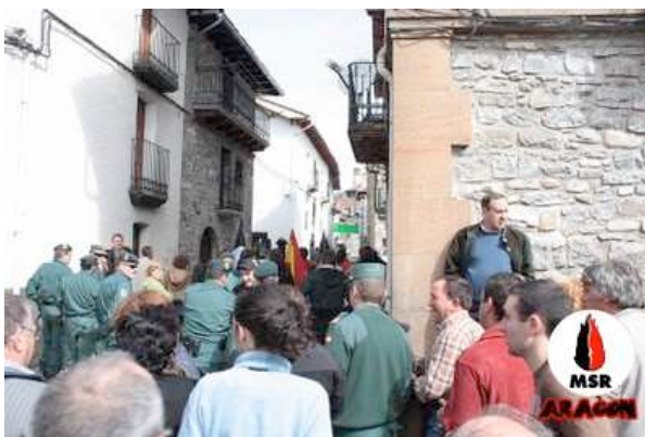
Acaba la concentración