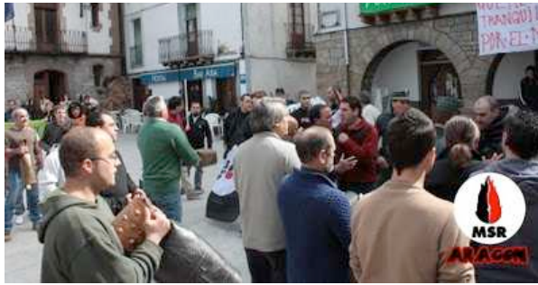
Tensión después de recuperar nuestra bandera aragonesa