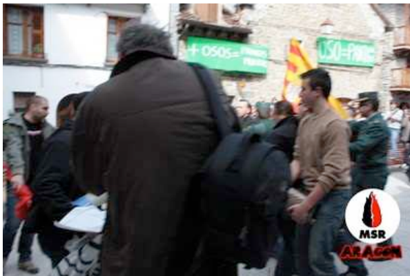
Parte izquierda de la foto: Los militantes del MSR recuperan su pancarta