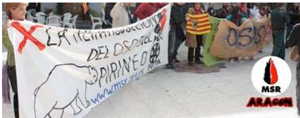
Mandan a críos para que se pongan con una pancarta antioso enfrente nuestro y para robarnos la nuestra