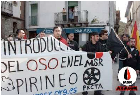
La pancarta semi-rota después del último intento de arrebatar-nos-la