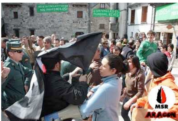
La Llama no se arruga pese a sus ataques