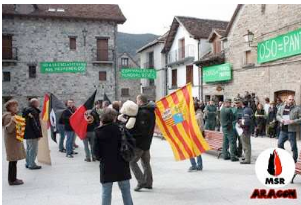
Momentos antes del inicio del acto 2

MSR EN V CONGRESO FIAMMA TRICOLERE, ROMA