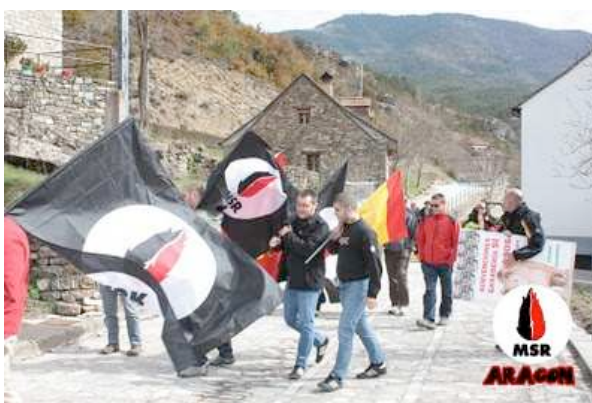
Camino de la plaza donde nos esperaban el resto de manifestantes