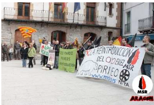
Comienza la concentración