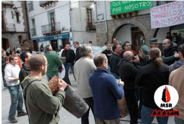
La llama no se arruga nunca