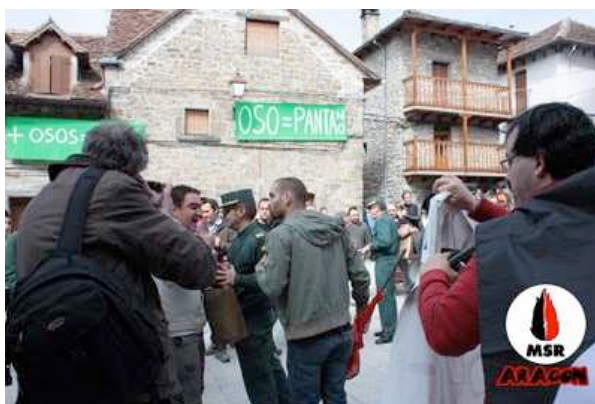
Se nos avalanzan encima