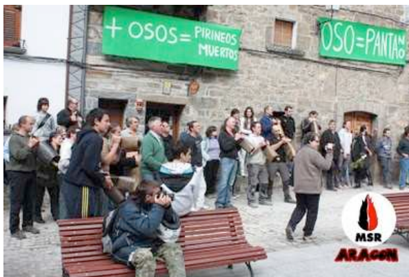
Comienzan a hacer sonar los cencerros para que no nos podamos expresar libremente

msrtelevision on livestream.com. Broadcast Live Free