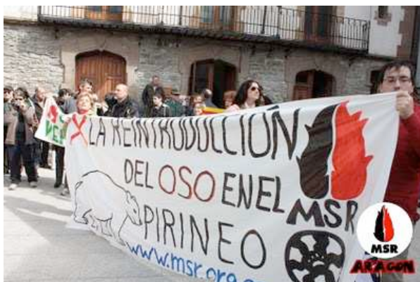
Pancarta del MSR y PECTA