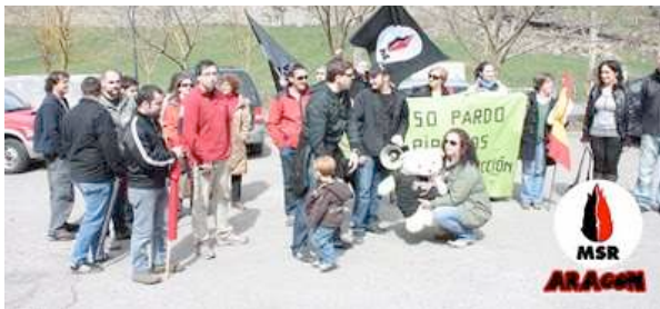
Foto de familia de parte de los integrantes de la manifestación pro oso al acabar el acto