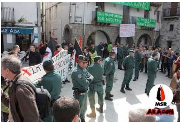
Momentos antes de acabar el acto