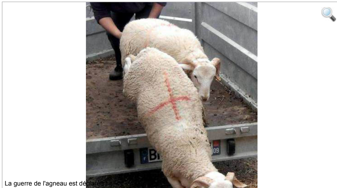
La guerre de l'agneau est déclarée

Depuis quelques jours, les éleveurs ovins français sont sur les dents. Chaque année à Pâques, temps fort de la consommation d'agneau, ils sont, en effet, victimes d'une concurrence déloyale de la part de la Nouvelle-Zélande qui inonde le marché de leur viande.