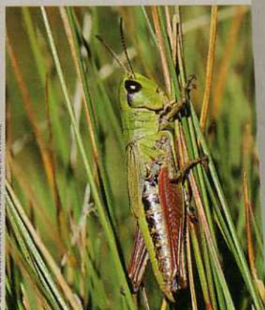
Criquet des pâtures