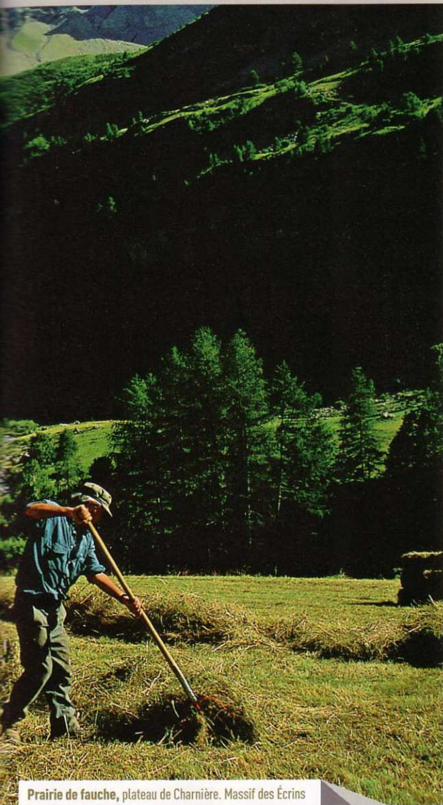
Prairie de fauche, plateau de Charnière. Massif des Écrins

renouées bistortes et trisètes dorés par des plantes plus adaptées au pâturage : pissenlits, achillées millefeuilles et pâturins des Alpes notamment.